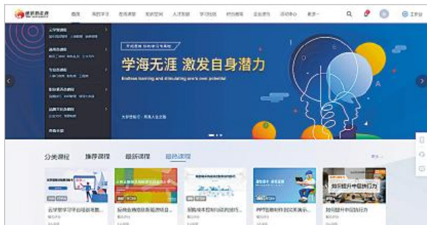
通威新能源培训学习平台上线