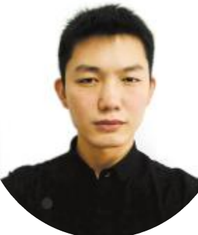
通威新能源科技(北京)有限公司开发部 董博会