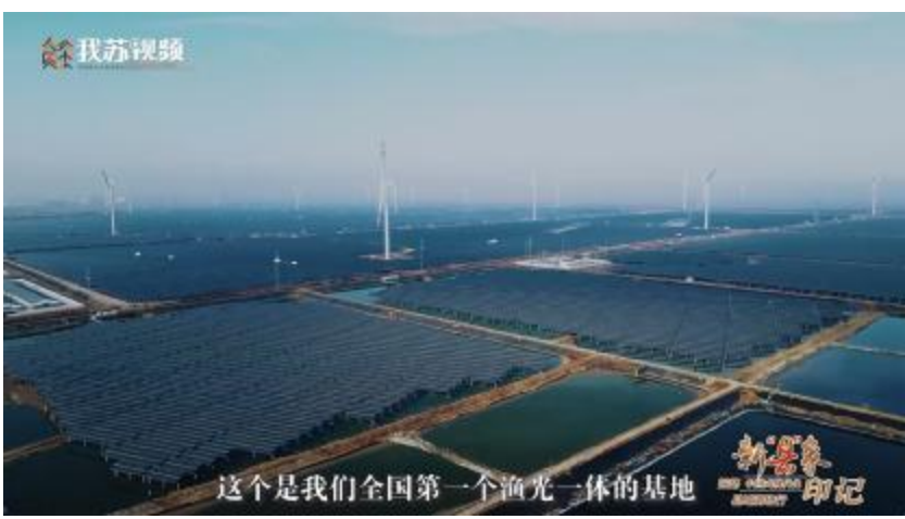
媒体聚焦通威如东“渔光一体”基地

通威“渔光一体”在水产和光伏两大产业之间找到一个最佳结合点,实现了清洁能源与水产养殖跨界融合,真正实现“渔、电、环保”三丰收。“上可产出清洁能源,下可产出安全水产品”,使“渔光一体”在端牢“能源饭碗”和“粮食饭碗”两大“国之大事”中承载了重要的积极作用,为乡村振兴提供了“通威方案”,受到越来越多水面资源富集地区的青睐,并吸引主流媒体的广泛关注。 记者 钟继辉