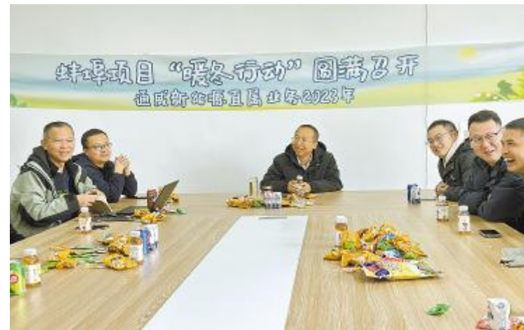
茶话会倾听一线心声