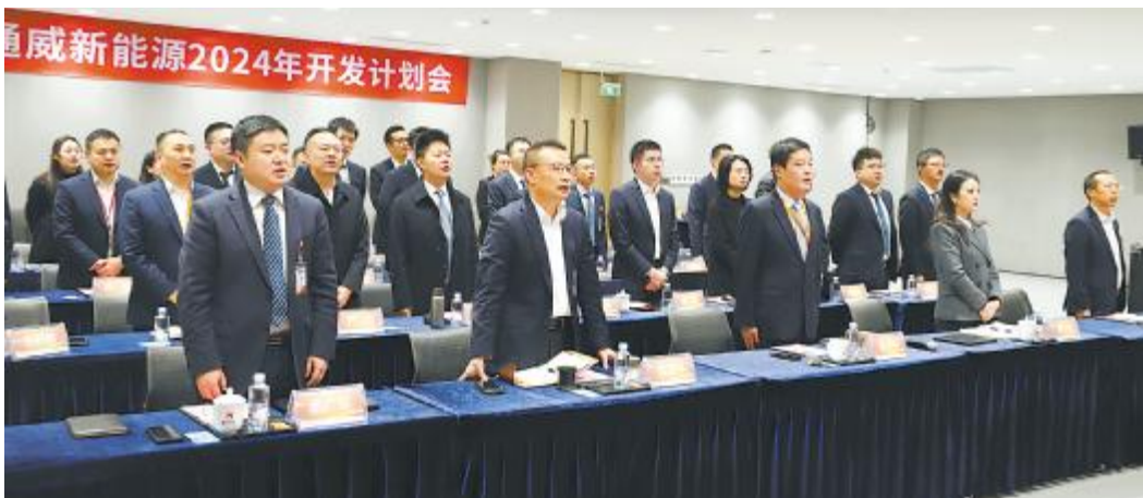
通威新能源 2024 年开发计划会现场