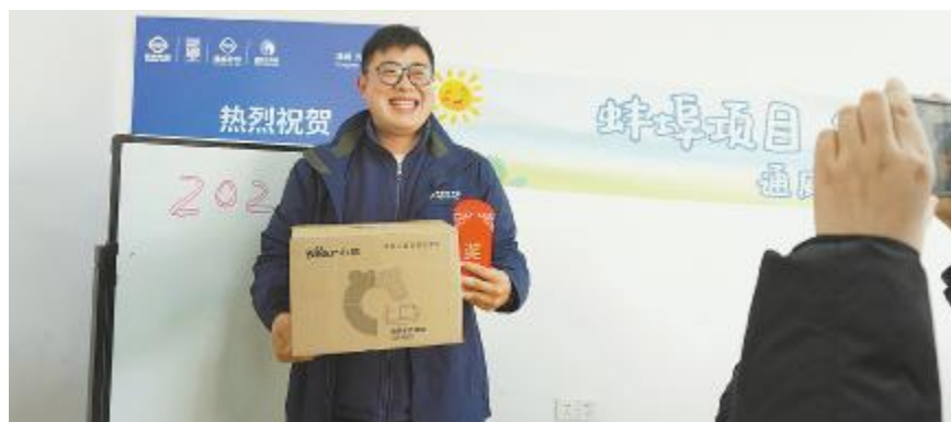
为一线员工送去冬日温暖

2023年12月,通威丰南“渔光一体”二期项目首批发电单元并网成功。项目建设过程中,面对挑战,全体工作人员迎难而上,攻坚克难,拿下山头,推动项目顺利并网。