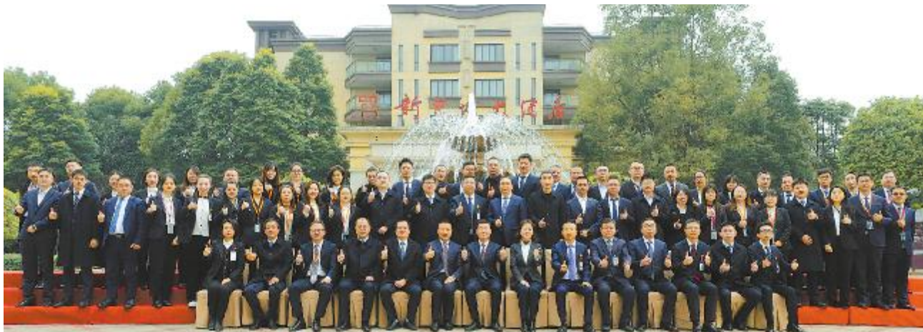
通威新能源召开 2023 年度工作总结暨 2024 年度工作计划会