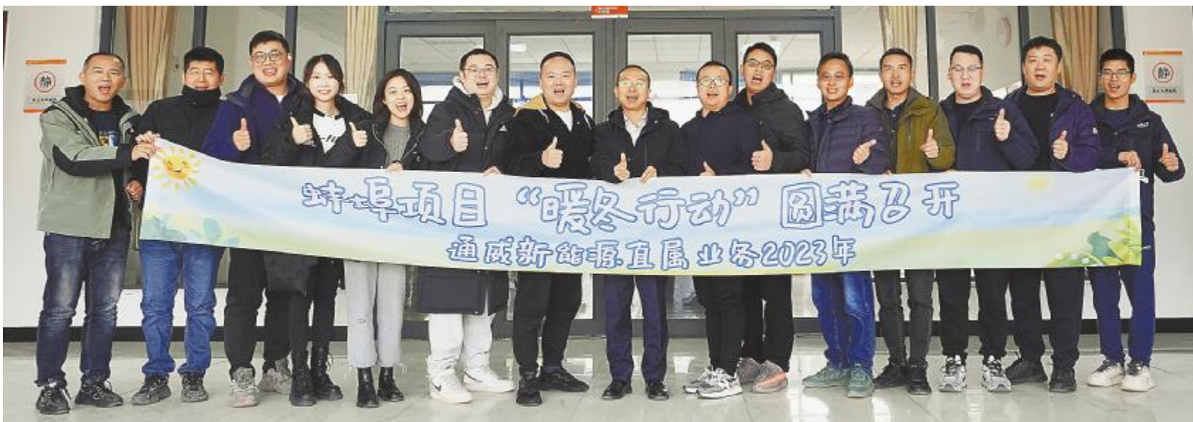
通威新能源直属业务暖冬行动走进蚌埠项目建设一线