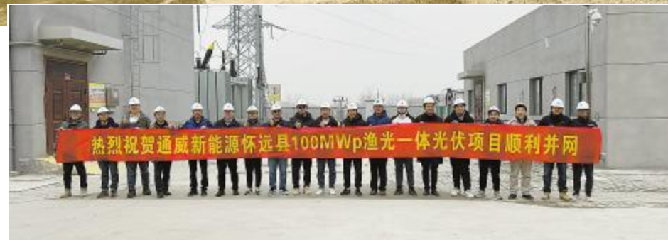
▲通威蚌埠“渔光一体”二期项目顺利并网