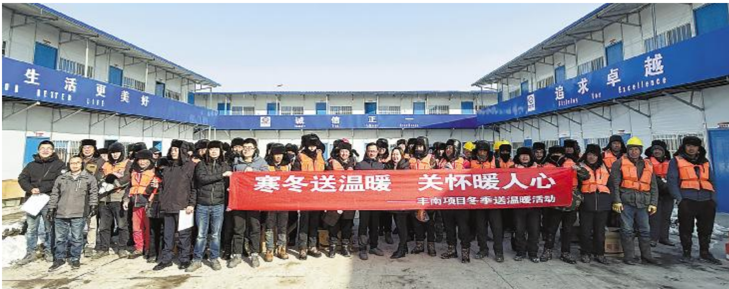
通威新能源北京公司开展“冬送温暖暖人心,凝心聚力鼓干劲”寒冬送温暖活动