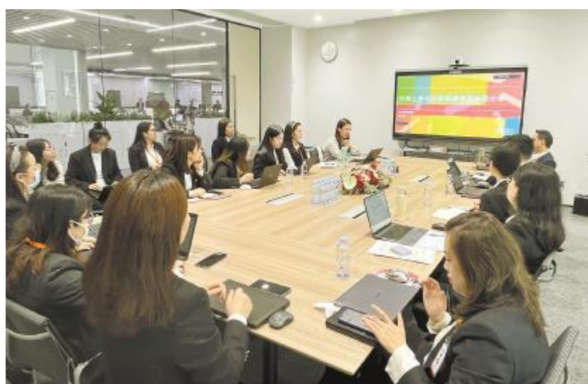
通威新能源开展法律专题培训